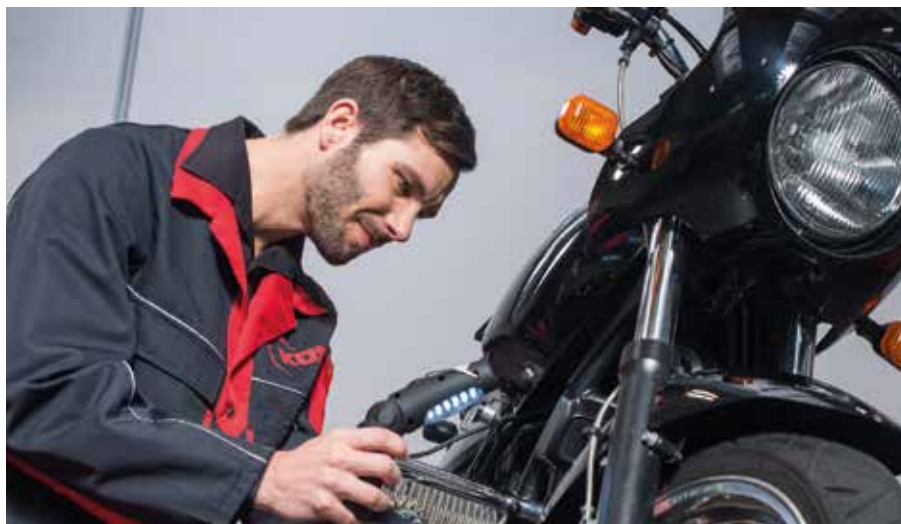
Der Frühjahrscheck sollte so intensiv wie möglich vorgenommen werden.

Beim Bewegen des Lenkers können Mängel im Lenkverhalten, wie Rastpunkte oder unterschiedliche Einschlagwinkel, erkannt werden. Achten muss man auch darauf, dass alle Gelenke und Züge freigängig und gut gefettet sind. Beleuchtung und Hupe müs-