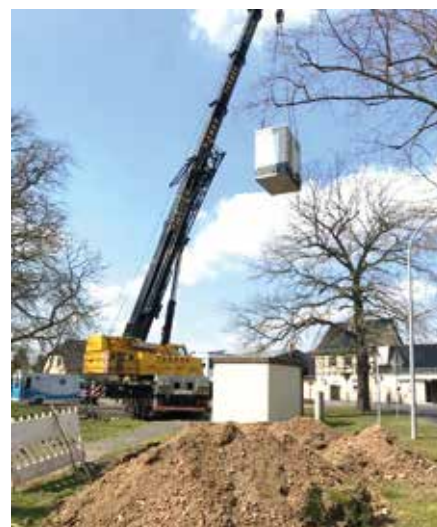
Hier schwebt der PoP in Eicha ein und findet auf dem Parkplatz am Wall seinen zukünftigen Standort.

Im sogenannten „POP“ (Point of Presence) laufen alle Glasfaseranschlüsse zusammen. Er leitet den ankommenden und abgehenden Datenverkehr weiter und verbindet das Netz vor Ort mit dem Rest der Welt – ein Internetanschluss mit Lichtgeschwindigkeit. Während der Bauphase beantworten die Mitarbeiter der Bauhotline alle Ihre Fragen rund um den Bau des Glasfasernetzes. Kurzentschlossen haben die Möglichkeit, auch jetzt während der Bauphase noch einen Vertrag abzuschließen. Weitere Informationen