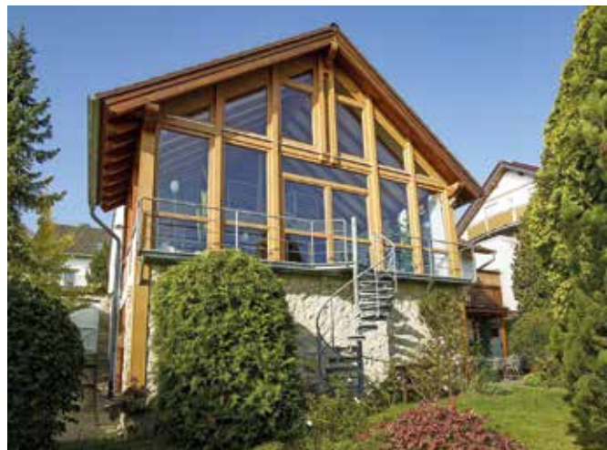
Renovierte Fensterfront in der Farbe Eiche hell