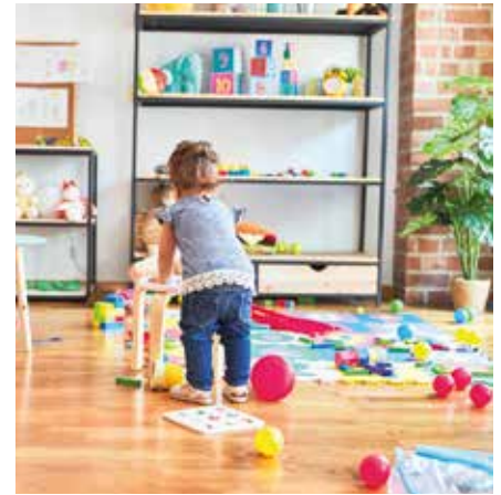
Kita geschlossen, Schule zu: Diese Kinderbetreuungskosten können Sie absetzen.

Auch wenn die betreuende Person kein Geld für die Kinderbetreuung nimmt, sollten Sie einen Vertrag für die Betreuung aufsetzen. Die Betreuungsperson schreibt ihren Name und ihre Adresse auf und bestätigt, dass sie Ihr Kind regelmäßig betreut und dafür eine Erstattung der Fahrtkosten erhält. Der Vertrag sollte so gestaltet sein, wie Sie ihn auch mit einem fremden Dritten aufsetzen würden. Die betreuende Person sollten Ihnen dann eine Rechnung über die entstandenen Fahrtkosten stellen, die Sie per Überweisung